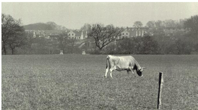
Arbejderboliger opført 1890-1920. Fotografen har stået på det nuv. Frilandsmuseum. Til venstre for koen ses to skorstene fra en mesterbolig ved Brede Alle.